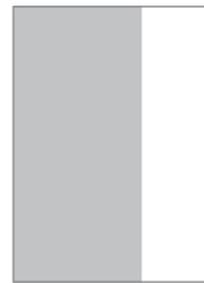
2/3 Seite, vertikal 140 mm x 297 mm