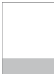
1/4 Seite, horizontal 210 x 74 mm