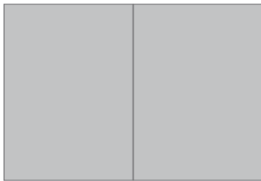
2/1 Seite 420 x 297 mm