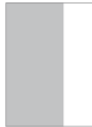
2/3 Seite, vertikal 140 mm x 297 mm