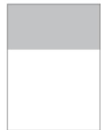
1/3 Seite, horizontal 210 x 70 mm