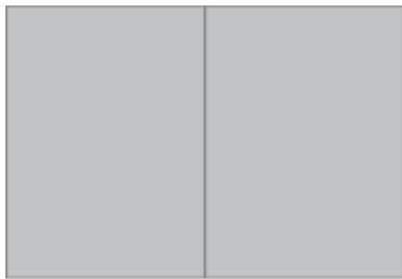
2/1 Seite 420 x 297 mm