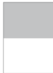
1/2 Seite, horizontal 210 x 148,5 mm