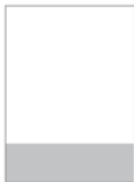
1/4 Seite, horizontal 210 x 74 mm