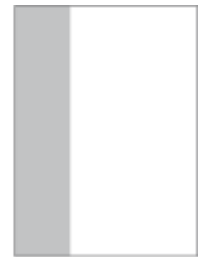
1/3 Seite, vertikal 70 x 297 mm