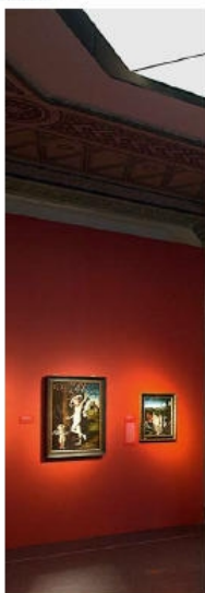
BUCERIUS KUNST FORUM