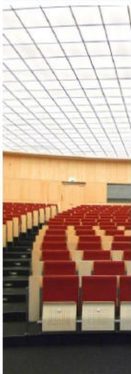
BUCERIUS LAW SCHOOL