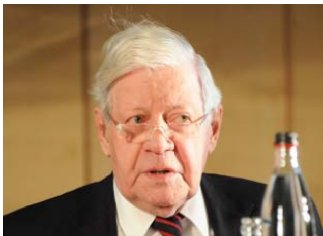
Altkanzler Helmut Schmidt

union genommen hat. Er sprach an, dass Europa schon viele Krisen überstanden habe, so zum Beispiel die Explosion des Ölpreises in den 70er Jahren. Nunmehr seien keine Währungs- oder Rohstoffspekulationen schuld an der Krise, sondern Finanzprodukte, deren Aufkommen keiner absehen konnte und deren Risiken sowohl die Banken als auch die Behörden nicht mehr richtig abschätzen konnten.