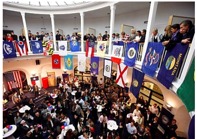
Der Moot Court während der Election Night

In der Nacht vom 4. auf den 5. November 2008 richtete die Bucerius Law School anlässlich der Präsidentschaftswahl in den Vereinigten Staaten Hamburgs größte Wahlparty aus. Rund 2.000 Gäste kamen in der Hochschule zusammen, diskutierten miteinander, informierten sich, und verbreiteten eine Stimmung, die nach der Hamburger Morgenpost „ausgelassen wie bei einem Fußballspiel“ war. Die „Election Night“ war eine Kooperation der Bucerius Law School mit dem US-Generalkonsulat in Hamburg und dem Amerikazentrum Hamburg e.V.